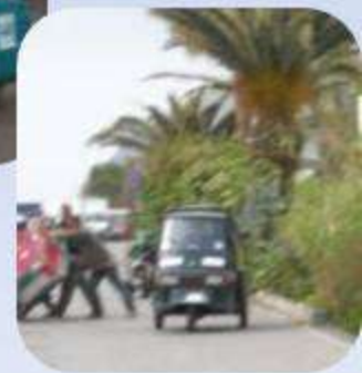
La vie « urbaine » sur l'île...