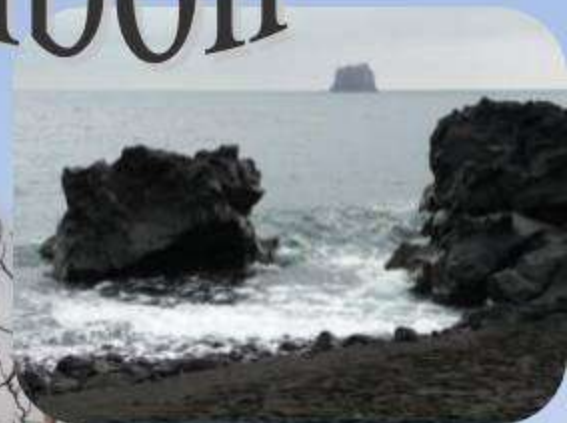
Au loin Strombolicchio