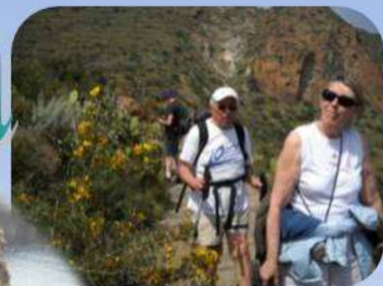
Calanque de Junco et ancien village mycénien surplombant la mer