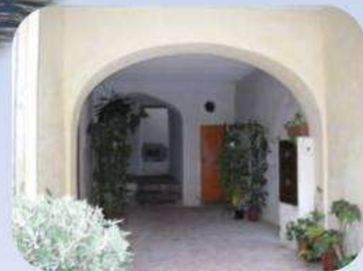
Chacun prend possession de son appartement