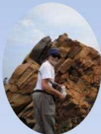
À la recherche de l'obsidienne et de pierre ponce