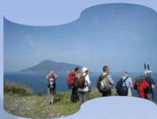
Panorama sur l'archipel depuis le Mont Pilato