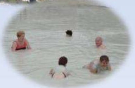
Bains de boue...