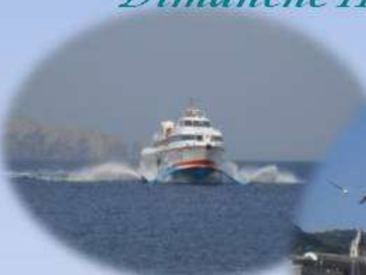
arrivée en Aliscafi