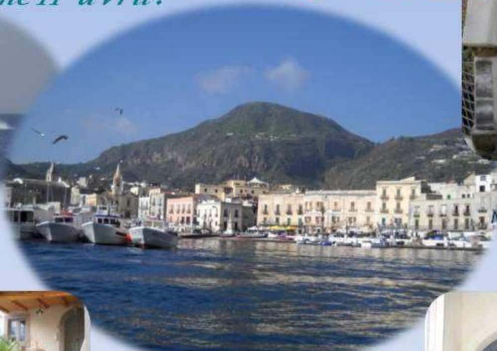
Nous sommes accueillis à la Résidence Acanto