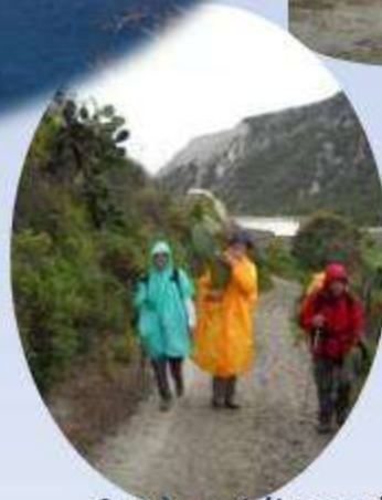
Après-midi sous la pluie mais pas de Picardie !