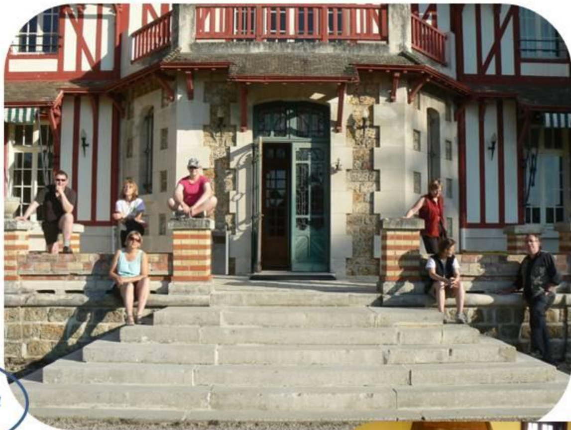
Une vie de château